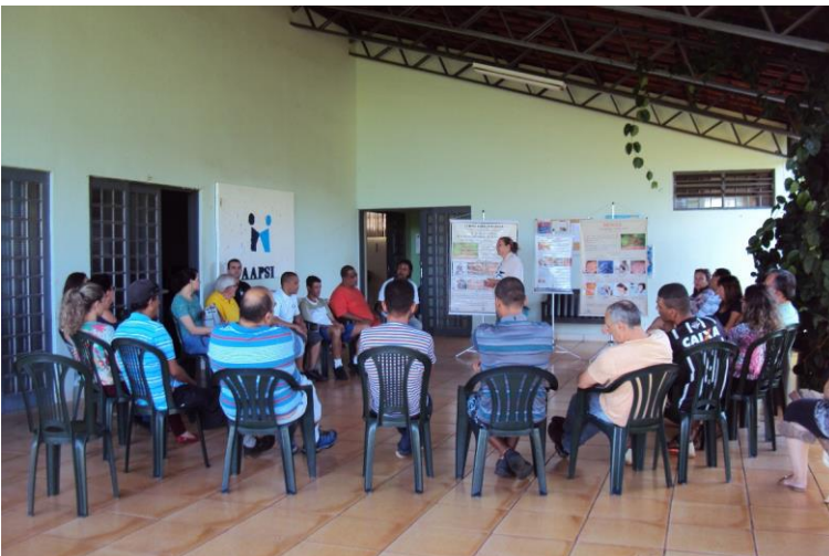
Grupo sócio educativo especial para usuários e familiares com os profissionais da saúde.