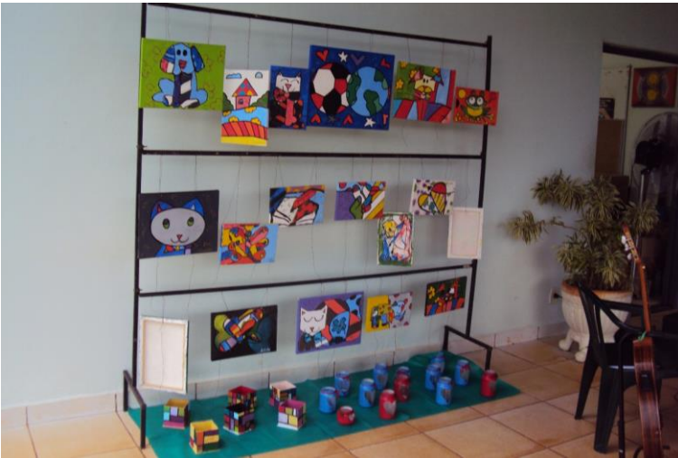
Exposição dos trabalhos realizado pelos usuários na Oficina de artes e pintura