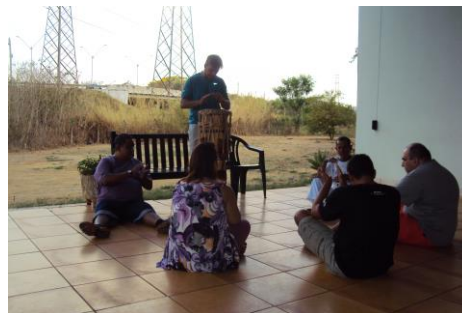
Apresentação e Oficina do Grupo de Capoeira da AAPSI