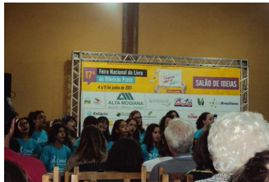
Visita a Feira do Livro